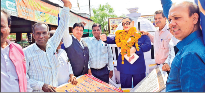
हरीभूमि न्यूज ▶ देवास